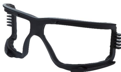
3M™ SecureFit™ Marco de espuma