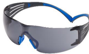
3M™ SecureFit™ 402SGAF Scotchgard - Gris