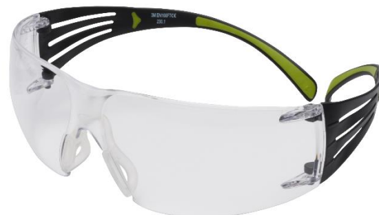
3M™ SecureFit™ 400