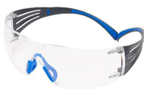
3M™ SecureFit™ 401SGAF Scotchgard - Claro