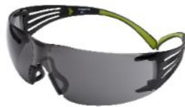
3M™ SecureFit™ 402AF Antiempañante - Gris