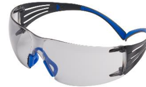
3M™ SecureFit™ 407SGAF Scotchgard - In Out

*Dependiendo del país se encuentran disponibles algunos modelos y opciones de lentes que podrían incluir marco de espuma.