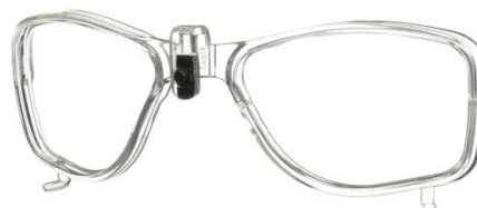
3M™ SecureFit™ Inserto de prescripción