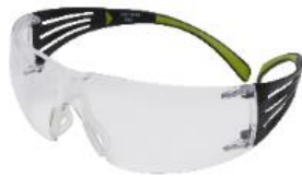
3M™ SecureFit™ 401AF Antiempañante - Claro