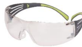
3M™ SecureFit™ 410AF Antiempañante - In Out